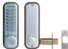
Verrou mécanique 2210 pêne dormant à larder.