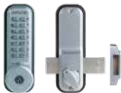
Verrou mécanique 2200CS pêne dormant en applique avec clé de secours.