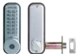
Verrou mécanique 2230CS pêne demi-tour à larder avec clé de secours.