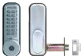
Verrou mécanique 2435CS pêne demi-tour à larder libre passage, avec clé de secours.