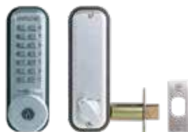
Verrou mécanique 2210CS pêne dormant à larder avec clé de secours.